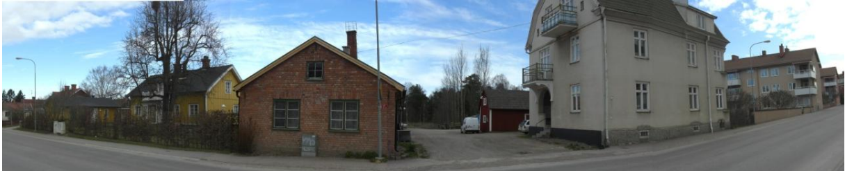
Befintlig bebyggelse mot Bergslagsgatan (Norrbyåkern 5, 6 och 7)

Stor varsamhet ska tas till bebyggelsens karaktärsdrag. Likaså är byggnadernas detaljer av stor betydelse för helhetsintrycket. Vid ändring ska bebyggelsens karaktärsdrag beaktas. Bebyggelsen skyddas därför av särskild bestämmelse på plankartan. Utökad lovplikt gäller därför vid fasadändring eller byte av takmaterial och fönster.