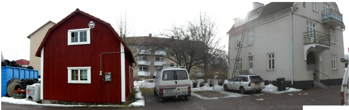
Befintlig bebyggelse inom Norrbyåkern 7.