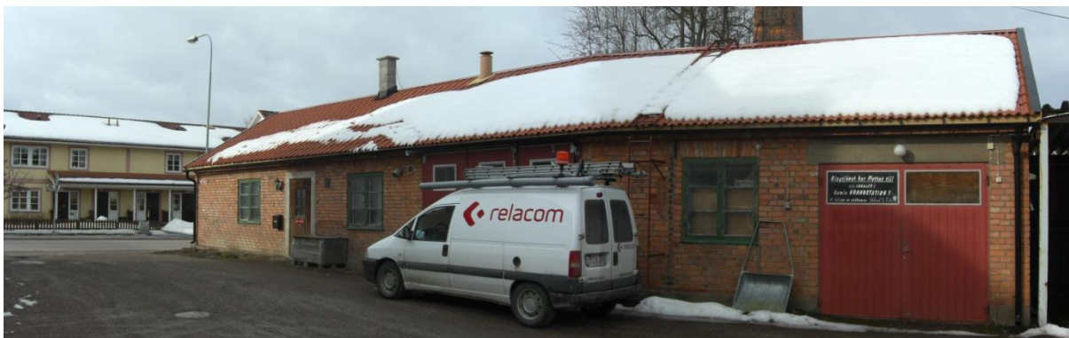
Befintlig bebyggelse inom Norrbyåkern 6