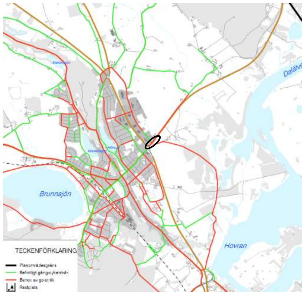
Bild 2: Utdrag ur Utvecklingsplan för Hedemora stad med omland. Planområdets ungefärliga läge är markerat med svart cirkel.

Planförslaget följer därmed utvecklingsplanens intentioner.