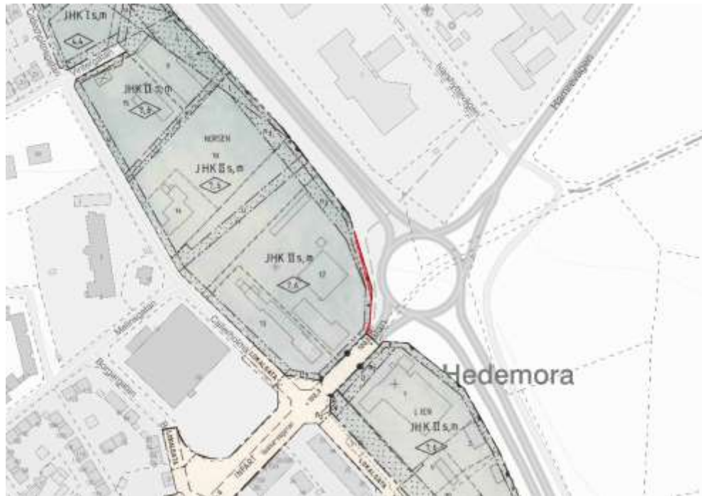
Bild 5: Karta där del av planområdet som avses upphävas är markerat med rött.

2083-P193, Detaljplan för Kv. Lien och Norsen, Hedemora kommun , laga kraft 24 juni 1998. Berörd del som upphävs har användning ej störande småindustri och hantverk samt handel och kontor samt är försedd med prickmark, mark som ej får bebyggas. Genomförandetiden gick ut 2013-06-24.