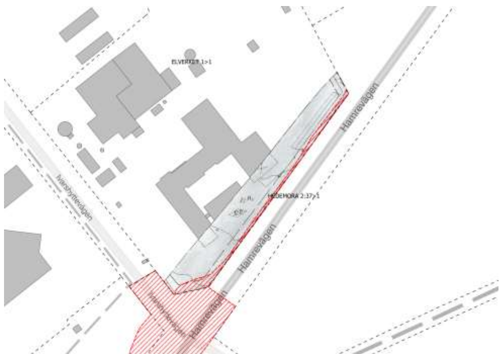
Bild 4: Karta där del av planområdet som avses upphävas är markerat med rött.

2083-P206, Detaljplan för Elverket 1, Hedemora kommun , laga kraft 11 december 2000. Berörd del som upphävs har användningsbestämmelsen industri och handel, ej livsmedel och berörs även av prickmark, mark som ej får bebyggas och utfart får ej anordnas. Genomförandetiden gick ut 2015-12-11.