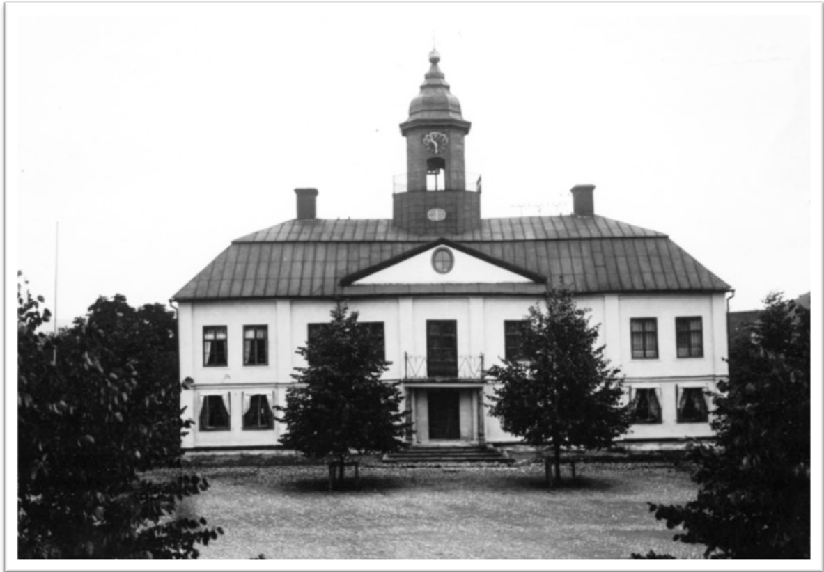
Rådhuset 1896. Här hölls stadsfullmäktige fram till kommun- sammanslagningen 1967.