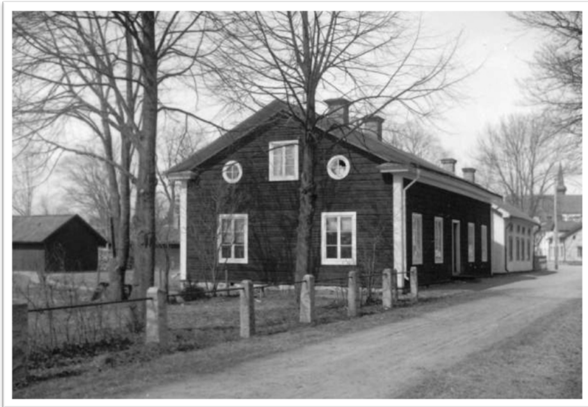
Gamla sockenstugan där Hedemora landskommun hade sin första kommunalstämma den 25 januari 1863.

På landsbygden byttes nu sockenstämmor ut mot kommunalstämmor och kommunalnämnder.