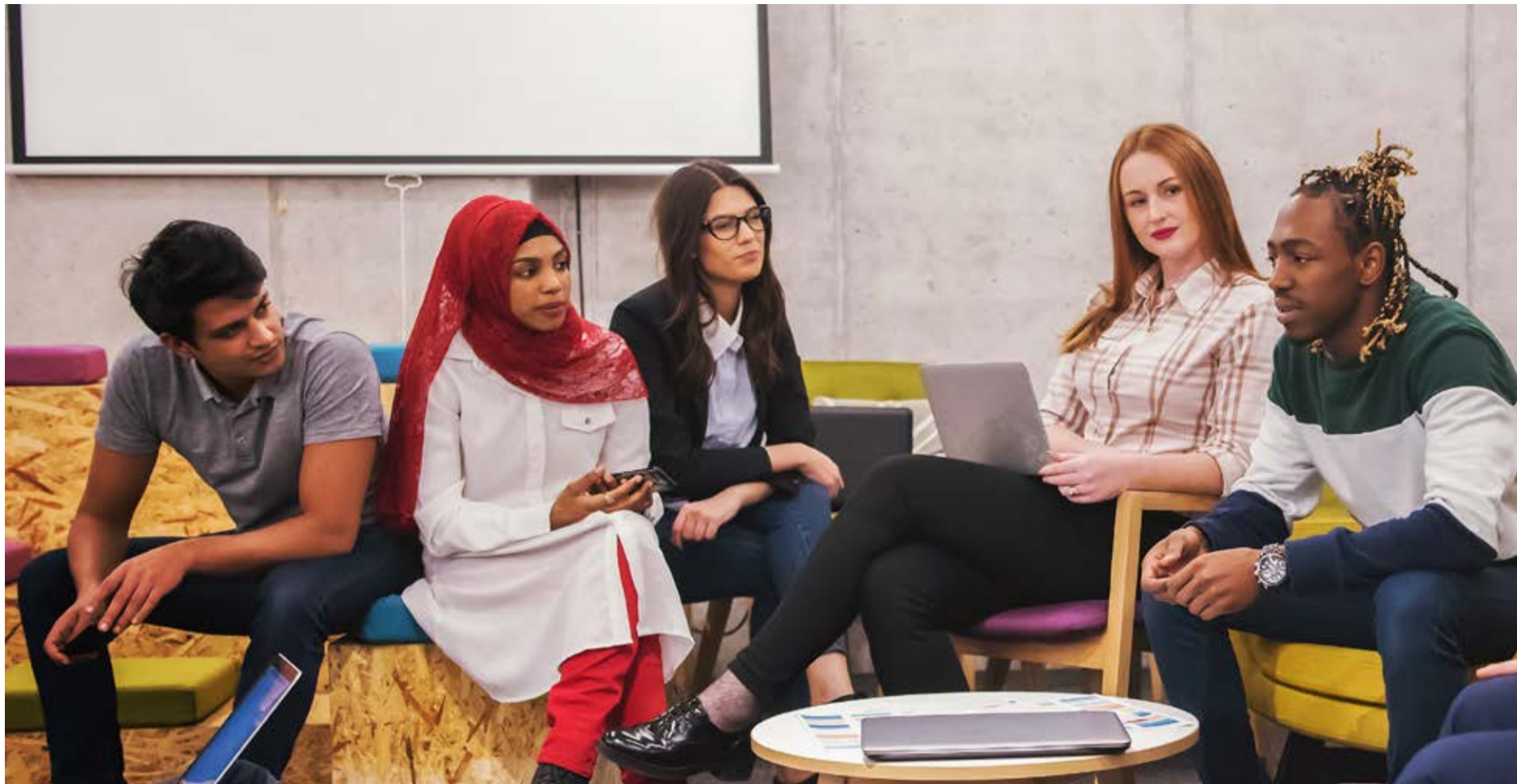
I projektet "En väg in" har bland annat speeddating med företag varit lyckat och har lett till anställning.